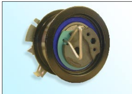
Fot. 1: 531 0565 30 (wersja stara)